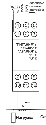
Рисунок 3 – Подключение прибора к однофазной сети через согласующий трансформатор тока