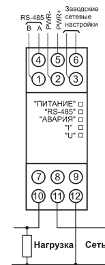
Рисунок 1 – Подключение прибора к однофазной сети